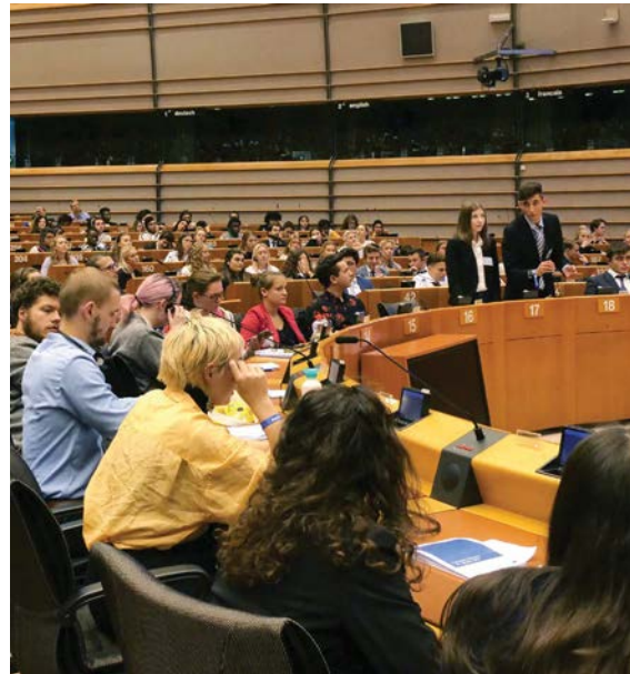
Молодіжний Парламент у Брюсселі

чесності, добросовісності та відповідальності.